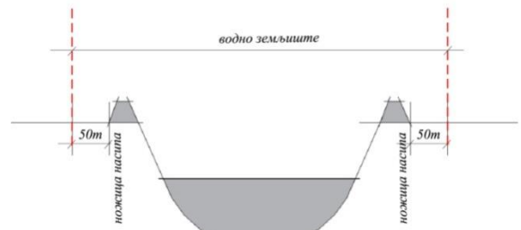
ПРИМЕР 2 – КАДА ИМА НАСИПА

У складу са чланом 77 Закона о водама, земљиште и водене површине у подручју шире и уже зоне заштите изворишта водоснабдевања, заштићени су од намерног или случајног загађивања. Обавезно је уређење и одржавање уже зоне заштите изворишта, које обухвата редовну контролу наменског коришћења земљишта.