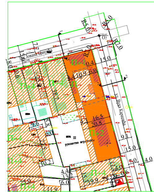
Извод из важећег ПДР-а