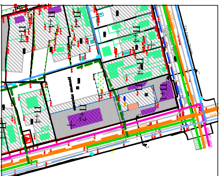
Извод из важећег ДПР-а